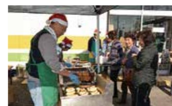
常総市水害緊急支援 (パン・アキモト)