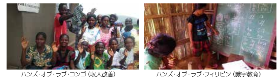
ハンズ・オブ・ラブ・コンゴ (収入改善)