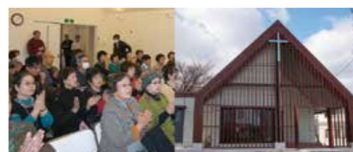
東日本大震災被災者支援・地域の憩いの場が完成