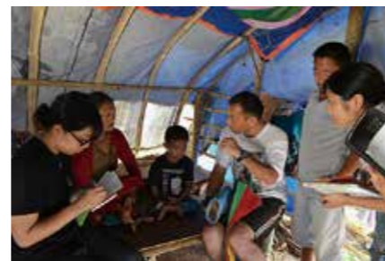
ネパール緊急支援キャンプ (健康調査)