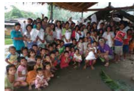
フィリピン台風被災者支援 (ハンズ・オブ・ラブ)